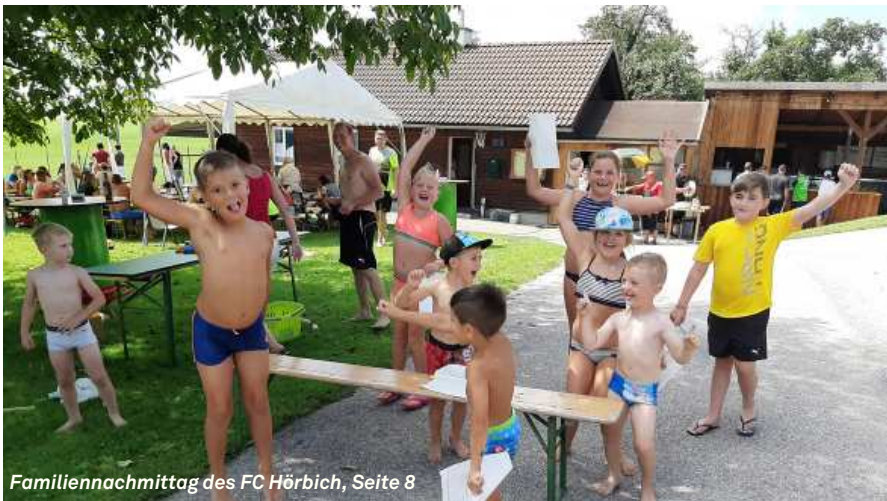
Familiennachmittag des FC Hörbich, Seite 8