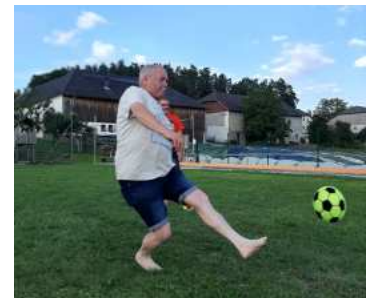
Familiennachmittag - Alt

Der Familiennachmittag mit dem Volleyballturnier war auch wieder gut besucht. Ob Klein oder Groß, Alt oder Jung – alle stellten ihr Können unter Beweis und hatten sichtlich Spaß daran. Erfolge wurden natürlich mit dem einen oder anderen Schnapsperl belohnt.