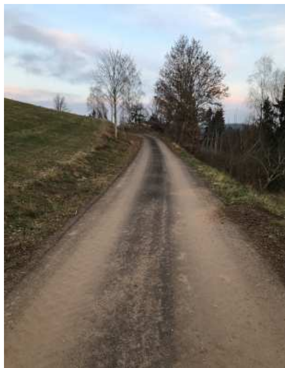
Sanierung eines öffentlichen Weges in Streinesberg, welcher landwirtschaftlich genutzt wird