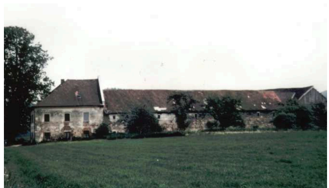
Der Tannberghof im Jahr 1975 unter dem damaligen Besitzer Wolfgang Wagner.