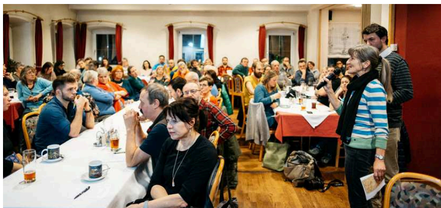
Infoveranstaltung zur Bio-Drehscheibe im Gasthaus Haderer

Im ARCUS Sozialnetzwerk war Bernhard Lang viele Jahre als Aufsichtsrat freiwillig engagiert. Mit nachhaltigem Erfolg, denn heute finden bei ARCUS mehr als 400 Men-