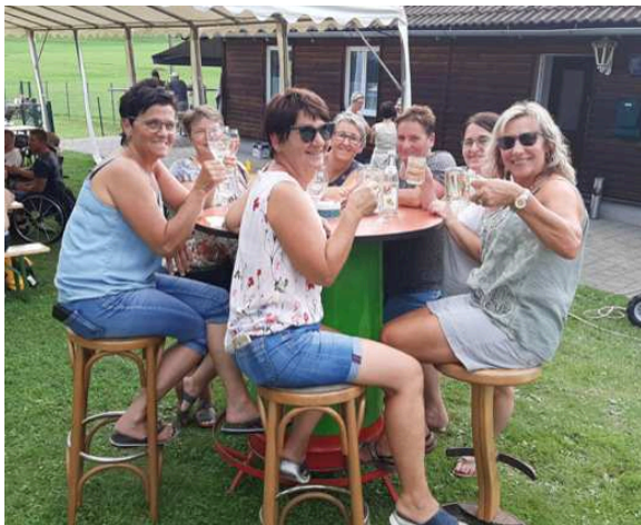
Gute Stimmung beim Familiennachmittag