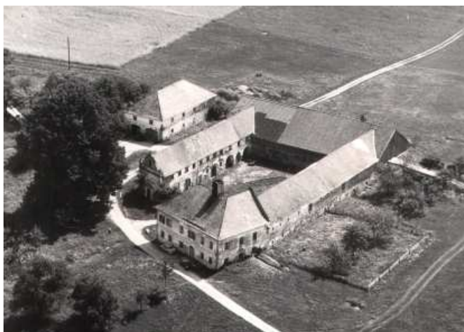
Flugaufnahme von früher