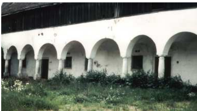
Der Tannberghof im Jahr 1975 unter dem damaligen Besitzer Wolfgang Wagner. Ehemaliger Meierhof der Burg Tannberg mit Laubengang 1650 erbaut.