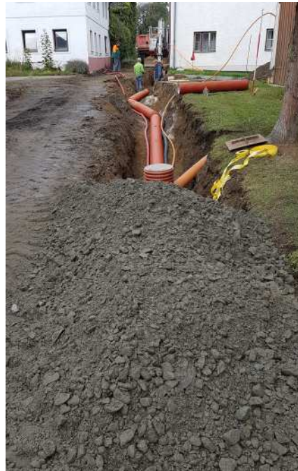
Sanierung Ortsdurchfahrt Eilmannsberg

Das vergangene Jahr hat uns einiges abverlangt. Fast täglich neue Gebote oder Verbote. Wir dürfen aber vor lauter Angst nicht darauf vergessen, dass wir Gemeinschaft brauchen und diese auch mit Abstand pflegen können, denn es wird wieder eine Zeit nach der Krise kommen.