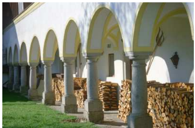
Der Laubengang heute