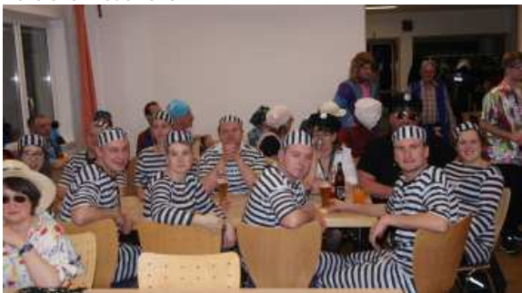
Hörbicher Roas 2020