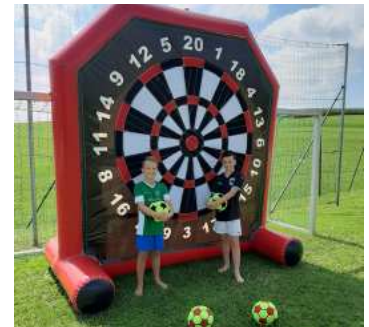
Familiennachmittag - Jung

Da uns heuer ein nicht eingeladener Gast namens COVID-19 besuchte, blieben unsere Grillabende größtenteils aus. Einen Grillabend beim Kegelcup im September konnten wir jedoch genießen. Das Kistenfleisch, welches von unseren Meisterköchen zubereitet wurde, war ein absoluter Gaumenschmaus.